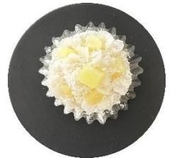
ココナッツ パイン